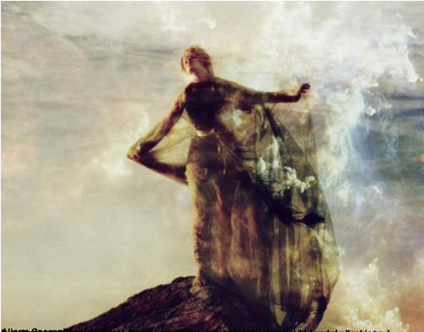
Albert Besnard, L'Épave, 1905, Musée de la Ville de Paris, Paris. https://www.musee-lavoisier.org/en/visiting-the-museum/exhibitions/1905-1906