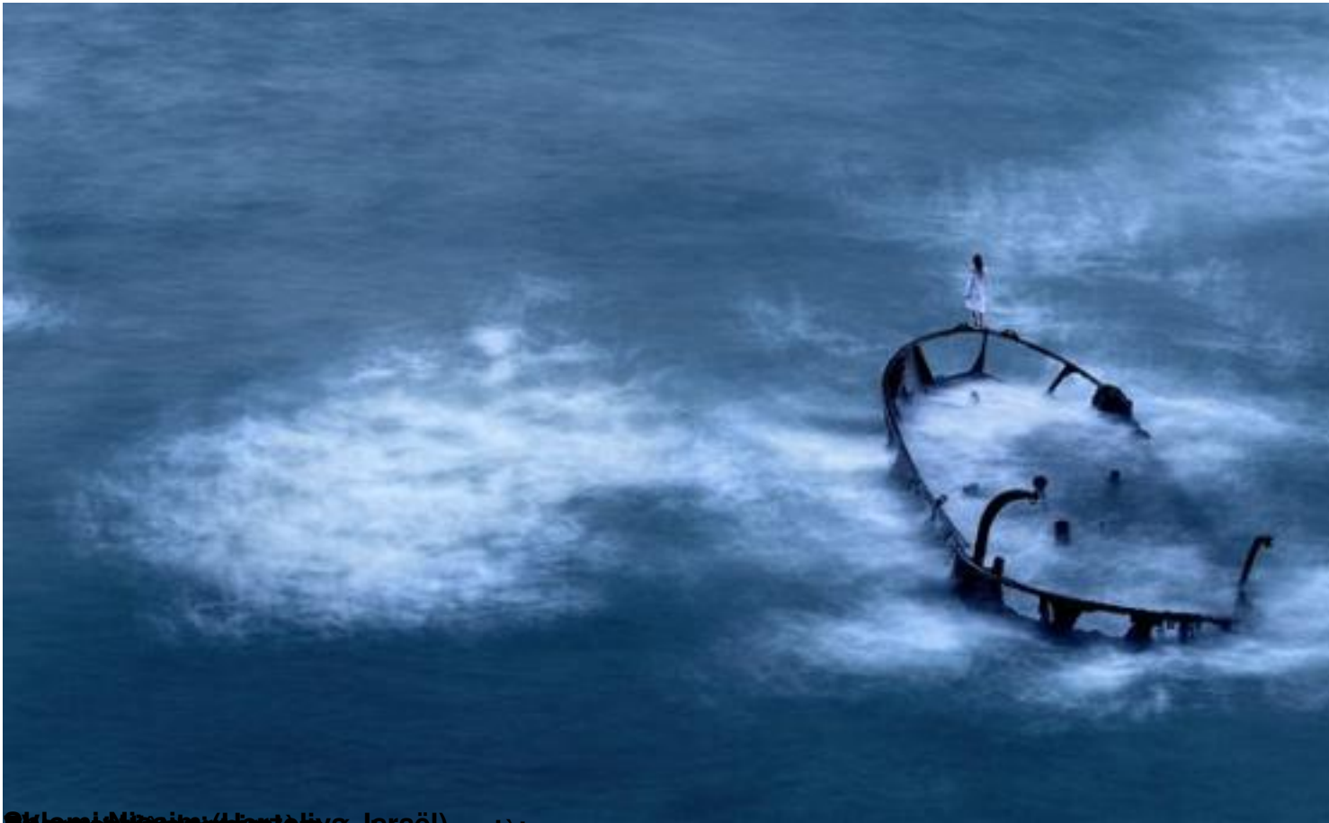
Blanc Mirais (Monte-Hua-la-à) Cung cấp bởi những người thợ săn cá voi